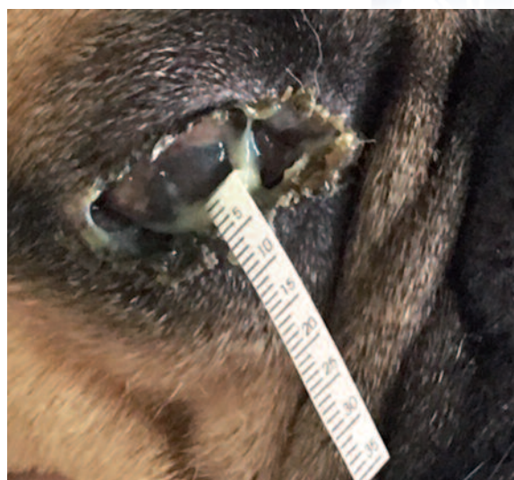
Test de Chirmer donde se aprecia la no producción lacrimal.